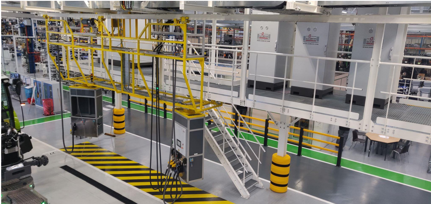
Plateforme de remplissage Multi-filling